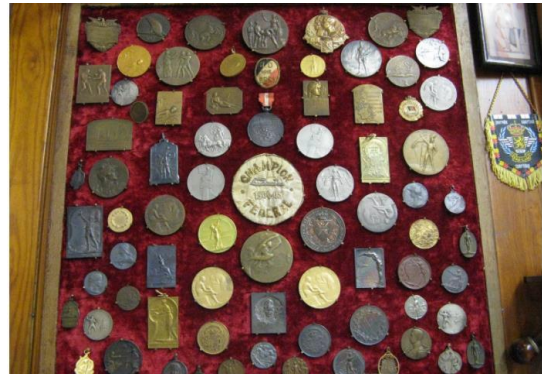
Figuur 5 Kader met 73 medailles.

Niet iedereen kan zich de beste materialen veroorloven om te sporten. De juiste materialen en technieken helpen nochtans veel sporters om een record te verbreken. Maar wat als iedereen met dezelfde kansen start: zullen de records dan nog blijven sneuvelen? Kan een record tot in de eeuwigheid worden verbroken? Discussieer met je groep. (Noteer hier een korte samenvatting van je discussie.)