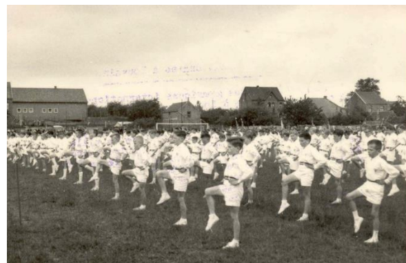
Figuur 1 Turn Gouwfeest Leerlingen te Bornem. Een zicht op de algemene oefeningen.

Waarom kiezen meer scholen bij het begin van de 20 ste eeuw voor de Zweedse variant van turnen, in plaats van de Duitse methode?