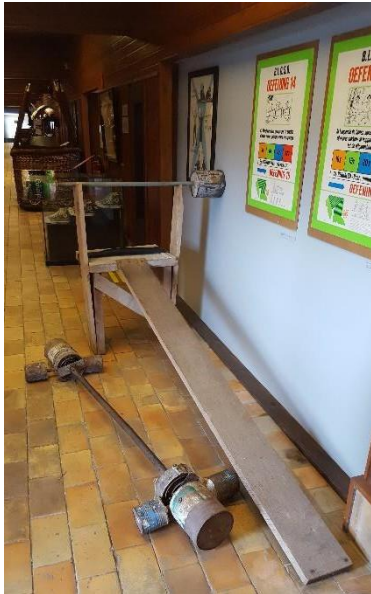
Figuur 4 Zelfgemaakt fitnessstoestel door een matroos.

Het is niet altijd vanzelfsprekend in vorm te geraken, als je niet de juiste materialen ter beschikking hebt. Toch is dit geen reden om te blijven stilzitten, dat bewijst onder meer de matroos die zelf een fitnessstoestel in elkaar knutselde om in beweging te blijven. Probeer nu zelf zo'n situatie te bedenken. Discussieer met je groep: hoe zou jij in vorm blijven op een onbewoond eiland? (Noteer hier een korte samenvatting van je discussie.)