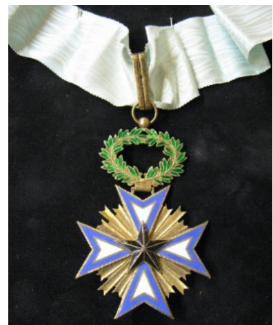
Figuur 3 Ereteken; ster aan wit lint.

In 2017 verdiende voetballer Cristiano Ronaldo 82,5 miljoen euro. Dat is heel wat meer dan wat een Olympisch winnaar in de Oudheid kreeg voor het winnen van zijn proef: een lauwerkrans. Welke andere manieren om een overwinnaar te eren vind je terug in dit onderdeel van de tentoonstelling?